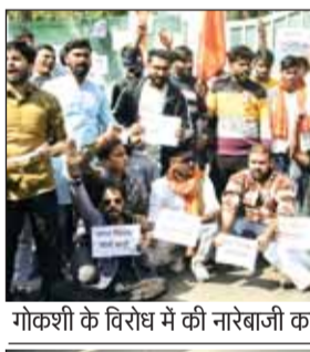
गोकशी के विरोध में की नारेबाजी करते प्रदर्शनकारी।